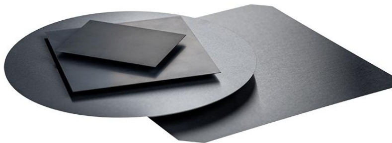
Führungsplatten aus Siliziumnitrid für Prüfkarten